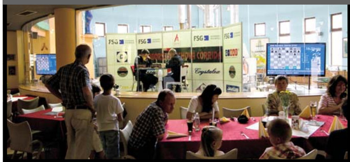
Ajeto restaurant, Nový Bor

(Partie budou pro diváky komentovat velmistrů novoborského extraligového týmu)